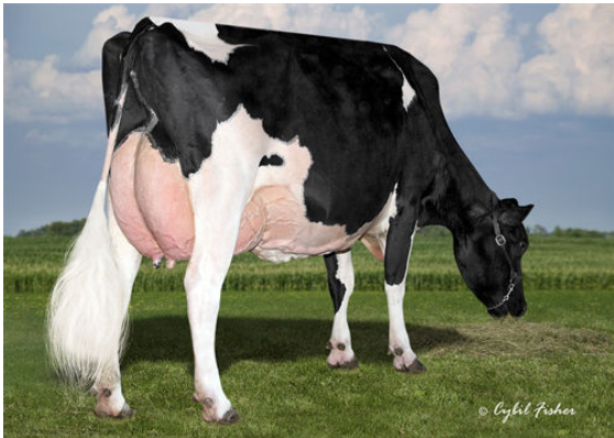
COOKIECUTTER MOG HANKER FIFTH DAM